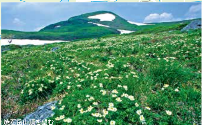
焼石岳山頂を望む