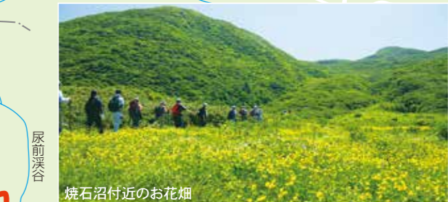
焼石沼付近のお花畑