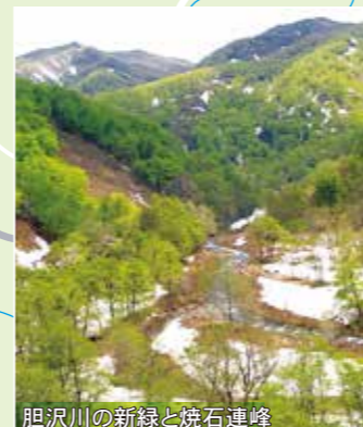
胆沢川の新緑と焼石連峰