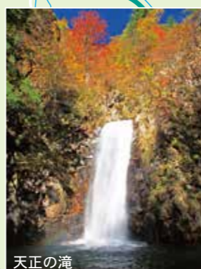
天正の滝 落差20m以上の滝で、双子天然スギが優美さを添える。新緑・紅葉の頃は特に見事。