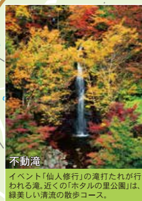
不動滝 イベント「仙人修行」の滝打たれが行われる滝。近くの「ホテルの里公園」は、緑美しい清流の散歩コース。