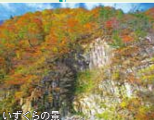
いずくらの景 天正の滝より、深流沿いに200mの地点。石英斑岩の柱状節理が50m以上垂直に切り立つ特異な景観。