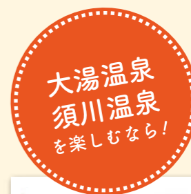
大湯温泉 須川温泉 を楽しむなら!