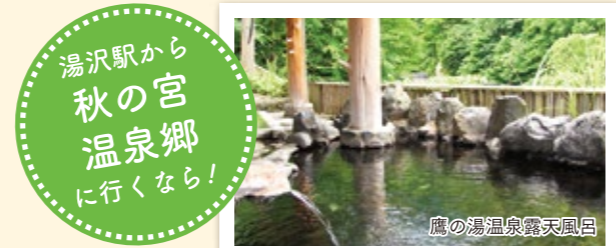
湯沢駅から 秋の宮 温泉郷 に行くなら!