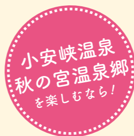
小安峡温泉 秋の宮温泉郷 を楽しむなら!