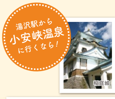
湯沢駅から 小安峡温泉 に行くなら!