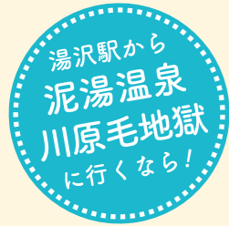
湯沢駅から 泥湯温泉 川原毛地獄 に行くなら!