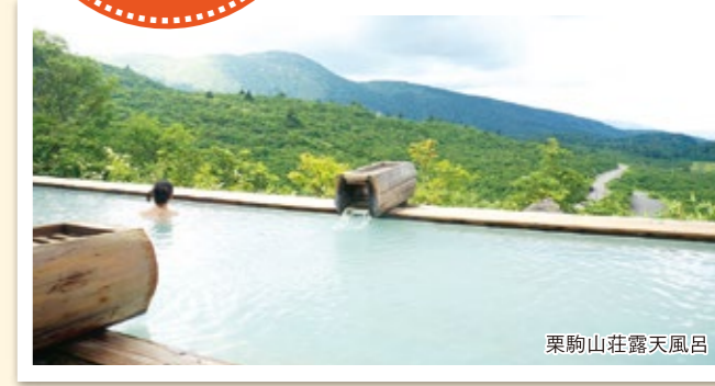
栗駒山荘露天風呂

小安峡温泉の奥にある「大湯温泉」は、秘湯の宿として川沿いの渓谷と温泉が楽しめます。「須川温泉」は、栗駒山の秋田県と岩手県の県境に位置し、風光明媚な地域として夏は栗駒山の登山やトレッキング、キャンプ、森林浴、秋は紅葉狩りが楽しめます。